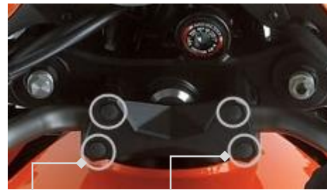
Foto 2 Schrauben die entfernt und ersetzt werden